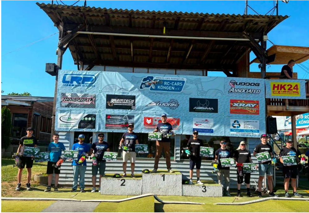
Podium 2 WDmod