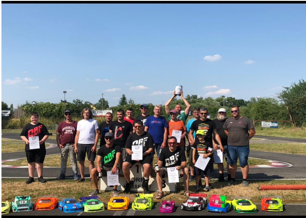
ORF Hassfurt e.V.

Vielen Dank an unsere auswärtigen Gäste sowie allen Zuschauern und Interessenten an unserem Hobby!