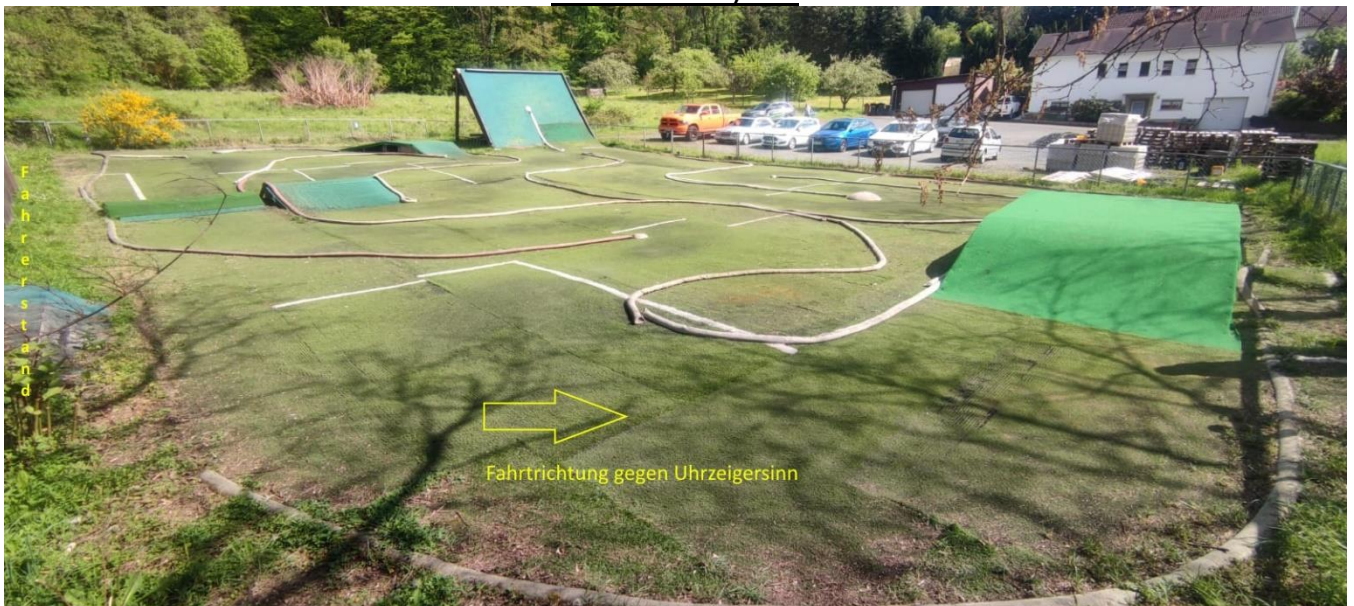
Gefahren wird auf Kunstrasen mit Gummi-/Sandstabilat entgegen dem Uhrzeigersinn.