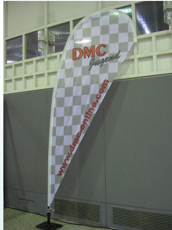
Abmaße 3,43m x 1,52m