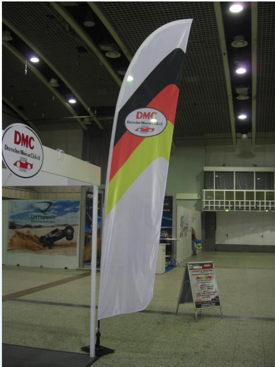
Abmaße 4,20m x 1,00m